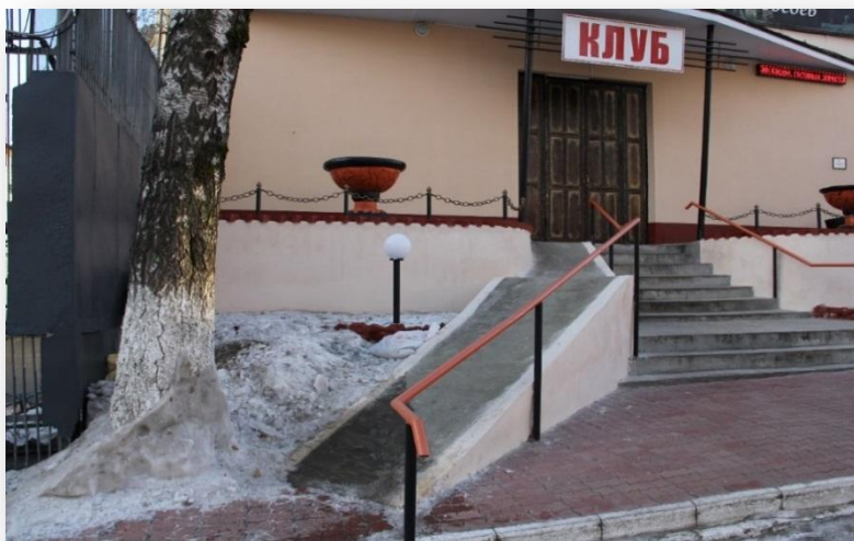
Фото № 1 Пандус не доступен для маломобильных осужденных (клуб исправительной колонии)

Если уклон пандуса больше 18 %, инвалиду-колясочнику потребуются посторонняя помощь для подъема. Пандусы, предназначенные для передвижения инвалидов в креслах-колясках, должны быть оснащены с обеих сторон одиночными или парными поручнями с учетом технических требований к опорным стационарным устройствам по ГОСТ Р 51261.