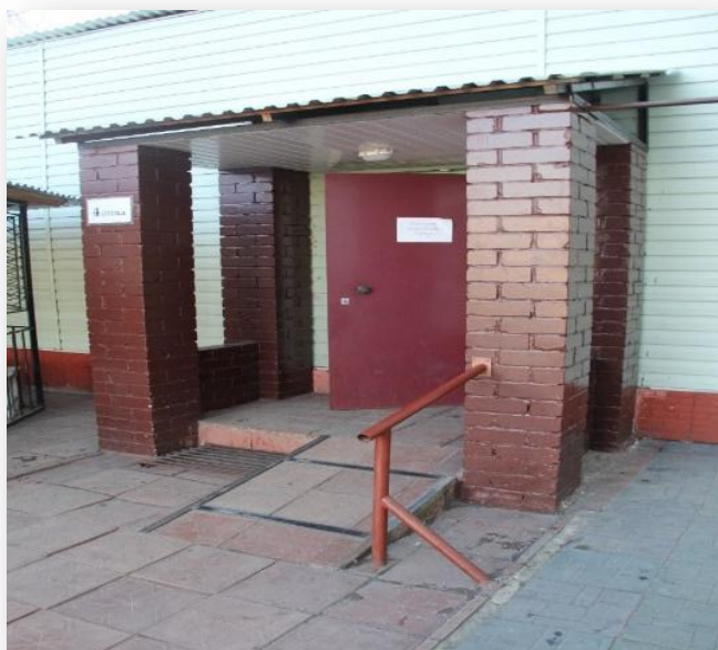
Фото № 2 Поручень располагается выше начала пандуса, а должен превышать длину пандуса с каждой стороны хотя бы на 30 см. (вход в отряд для инвалидов в исправительной колонии)